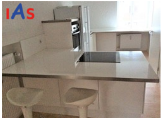
EBK mit Theke