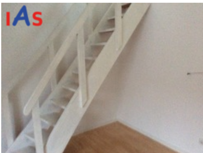
Treppe zur Maisonette