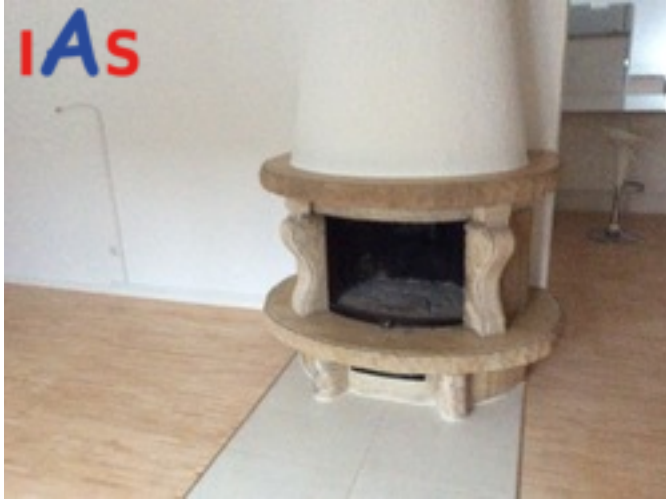
offener Kamin im Wohnbereich