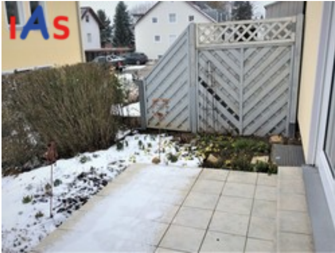
Terrasse mit Markise