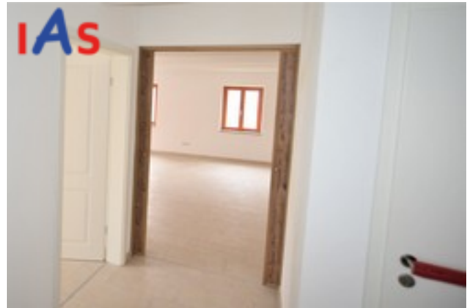
Schiebetür zum Wohnbereich