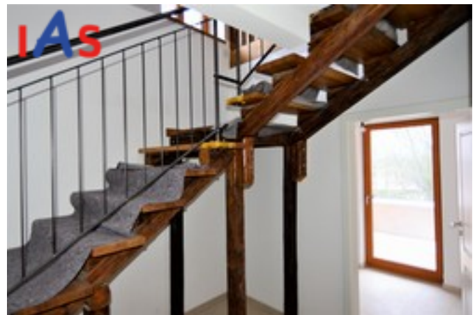
Treppe zur Maisonette